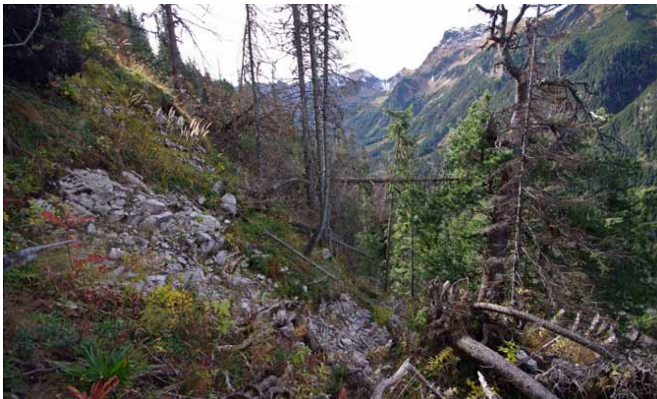
Zavedenie bezzásahového režimu v TANAPe spôsobilo rozvrat v smrečinách, následkom je postupujúca erózia pôdy.

■ V roce 2017 vznikla občanská ekologická iniciativa „My sme les“, která získala příznivce z řad známých osobností, ale i vědců. Tato iniciativa poža-