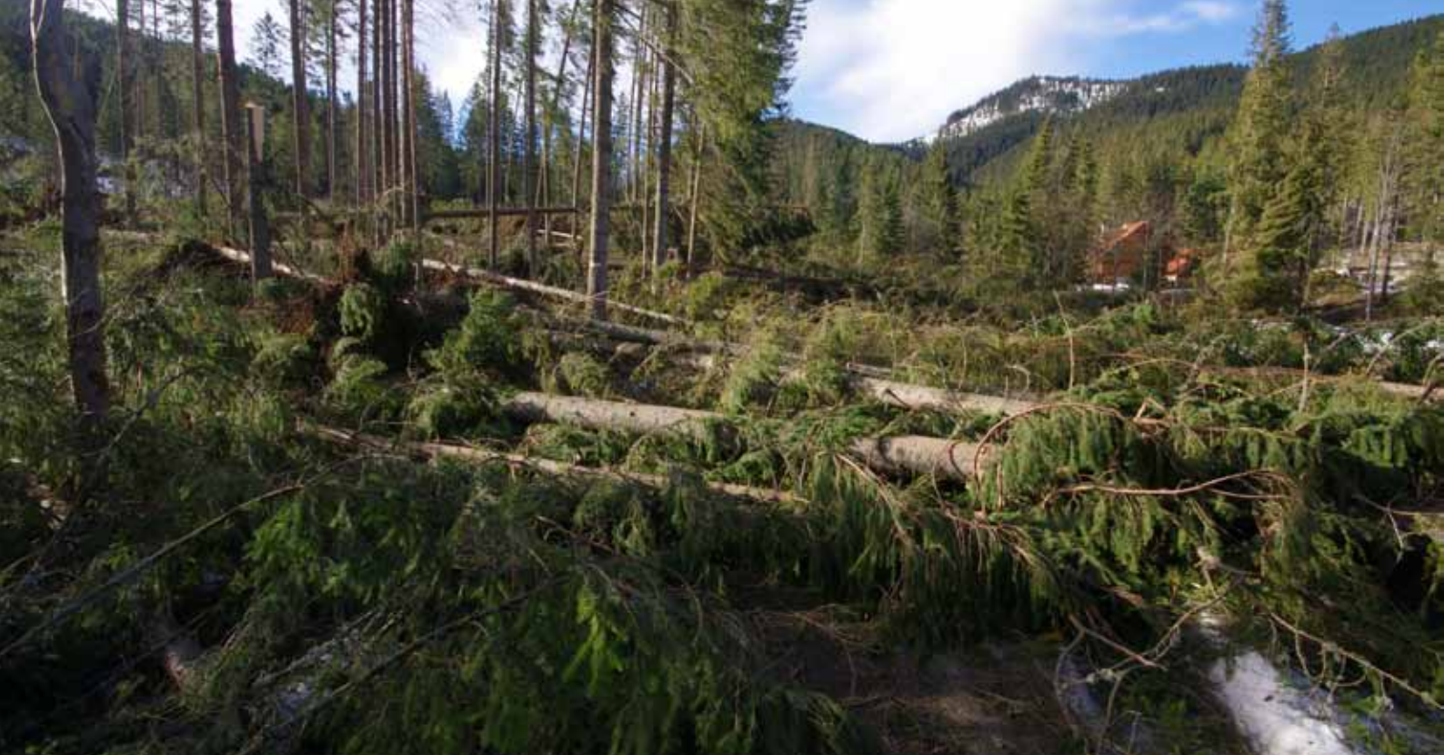
Veterné, snehové a následné lykožrútové kalamity spôsobujú dlhodobo vysoký podiel náhodných ťažieb.

duje ponechať najmenej päť percent rozlohy Slovenska bez zásahů človeka (pro srovnání Hnutí Duha v ČR chce prosadit bezzásahovost na třech procentech území ČR). Tato bezzásahová území by pravděpodobně byla převážně v lesích. Jakou podporu má daný návrh u široké veřejnosti, resp. politické reprezentace?