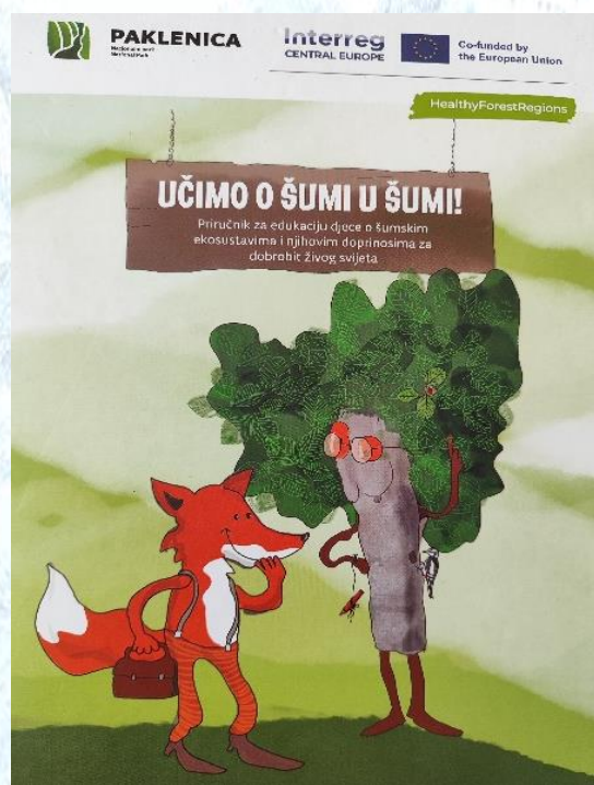
Metodický materiál "Učíme o lese v lese" vytvorený chorváckym partnerom - NP Paklenic

Zaujal i program s názvom „Pojďme s vlky výti“ zameraný na poznávanie vlka dravého, jeho spôsobu života, špecifiká správania a spolunažívania s človekom. V rámci programu mali účastníci možnosť zažiť tvorbu hierarchie vo vlčej svorke, pachovú identifikáciu vlčích teritórií a pohyb vlčej svorky, poznávanie trusu vlka a zážitkovú simuláciu lovu koristi vo vlčej svorke. Českí lesní pedagógovia sa zaujímali o systém fungovania a podpory lesnej pedagogiky na Slovensku. Rovnako prejavili záujem o zdieľanie metodík programov a inšpirácií na ďalšie aktivity lesnej pedagogiky.