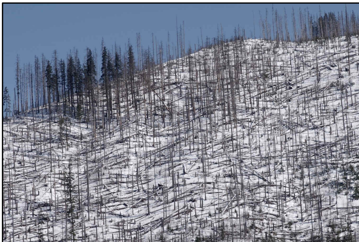
Obr.5 Pohľad na NPR Javorová dolina, rok 2021, ochranársky prístup