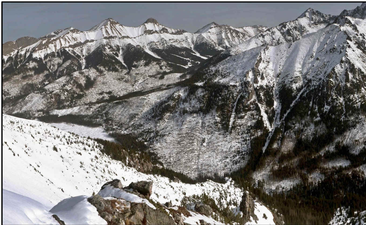
Obr.1 NPR Belianske Tatry a NPR Javorová dolina, rok 2021, ochranársky prístup