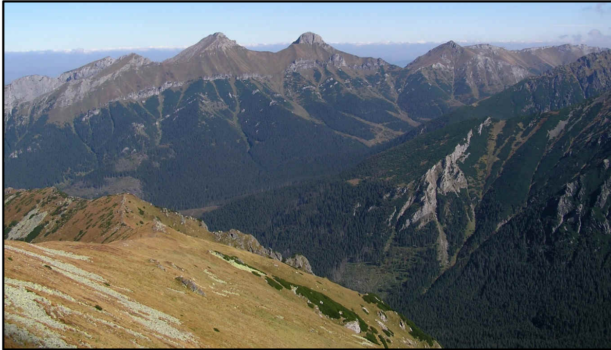
Obr.1 NPR Belianske Tatry a NPR Javorová dolina, rok 2002, lesnícky prístup, foto Slivinský