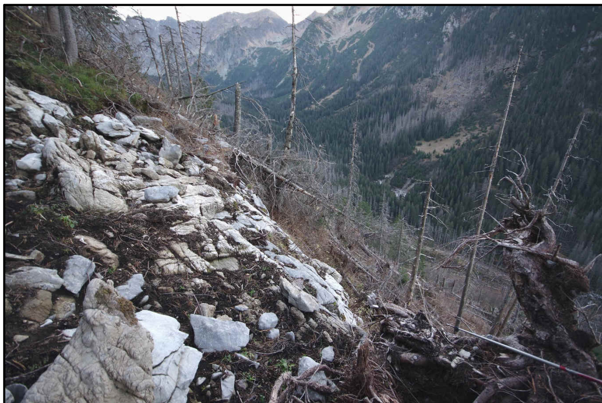
Obr.6 Pohľad na NPR Javorová dolina, rok 2021, ochranársky prístup